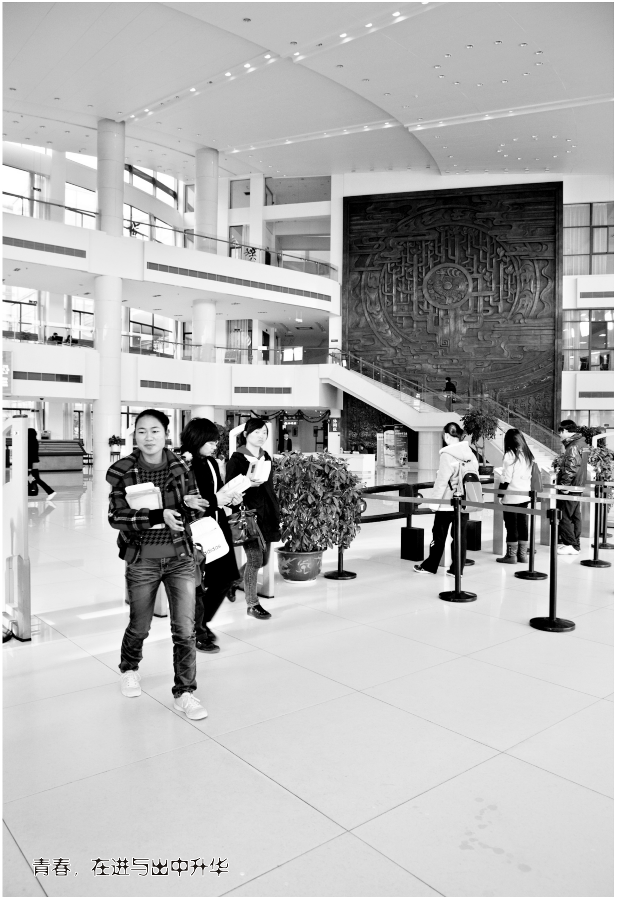
青春，在进与出中升华